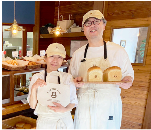
ベーカリー・ジャムをよろしくお願ひします