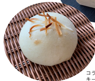
コラボ キーマカレーパン

また、長野県のおかげで支障も何度も利用させていただき経営、商品開発、上席支援でのSNS対策など様々な分野の専門家の方々に相談に乗っていただきました。