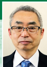
長野県商工会連合会 上席専門経営支援員 (AI・IoT・DX戦略支援担当)