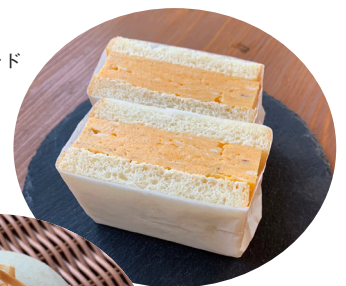
コラボ 厚焼き玉子サンド