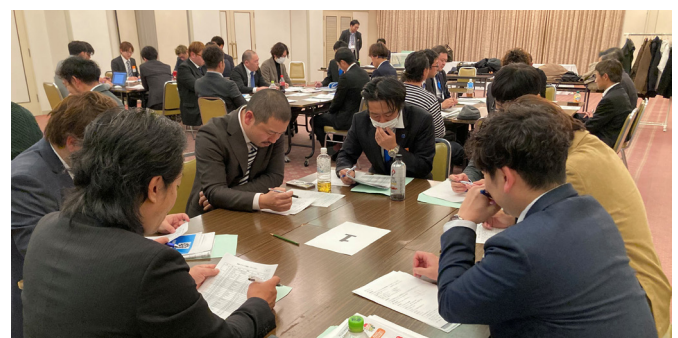
県青連4ブロック交流会

制の改善、青年部の価値再定義といった具体策が示されました。交流会は互いの理解を深めるとともに、今後の組織強化に向けた重要な機会となりました。