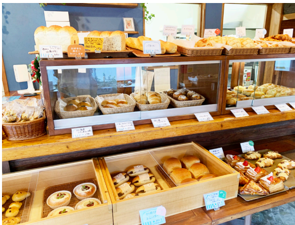
たくさんのお菓子の並ぶショーケース

開業からたくさんのお客様に支えられて、色々な方々と関わりながらここまで来る事が出来ました。商工会の職員の方々にも、自分だけで考えていても前に進めない時に、親身になって一緒に考えていただきました。