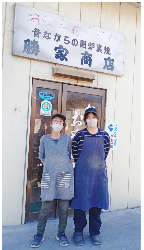
旧店舗の前で(左)店主、(右)後継者

灰焼きおやきは派手な食べ物ではありません。でも、だからこそ飽きず、暮らしに寄り添ってきました。これからは変わらぬ味を守りながら、時代に合わせて伝え方を変えていく。新店舗は、その第一歩です。私はこれからも火を絶やさず、家族と地域とともに、この味を未来へつないでいきます。