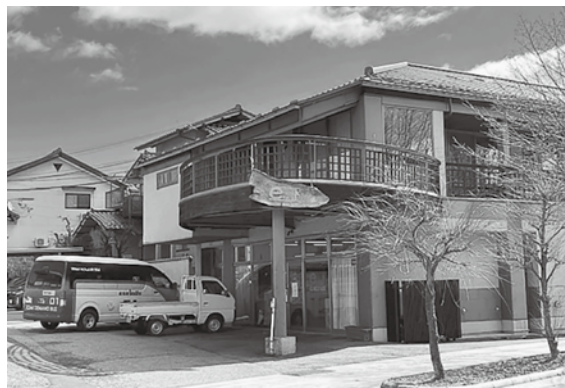
デマンドバスとうみレッツ号と東御市商工会全景

や利用方法のご案内等、商工会が対応しています。新たに今年三月、「とうみレッツ号」にAIシステムを導入し利便性を高め、採算面での改善を図り、持続可能な交通システムの運用を目指してまいります。