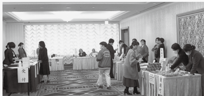
レディースフォーラム2023開催に合わせて開催した物産展の様子