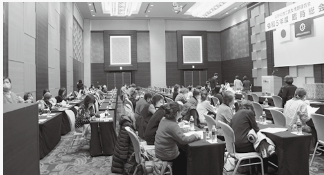
県女性連臨時総会

さらに、能登半島地震の義援金募金も実施し県女性連対応分と併せて全女性連に送金いたしました。