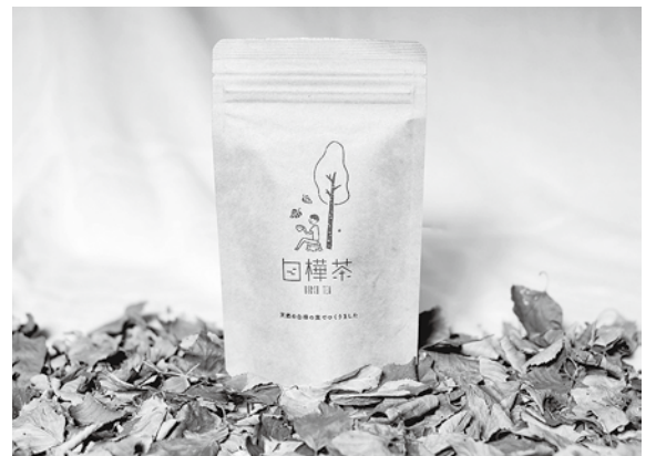
白樺茶(ティーバック10包入)

私たちの強みは、私たちの取り組みに賛同してくださる有志のメンバーが約100名いることです。シラカバを中心とした、人との繋がりも広がっています。