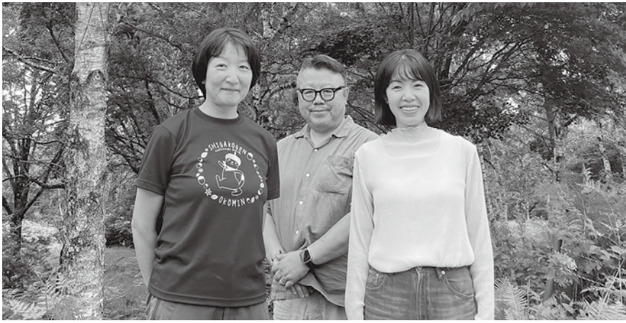
創業メンバーと(向かって右が渡部)