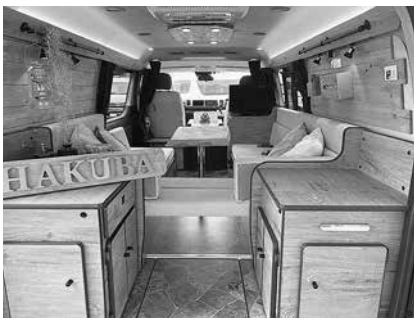
新製品のヒントとなったキャンピングカー・かーいんてりあ高橋オリジナル「リラックスワゴンHAKUBA」

地震などの災害の際、車中泊避難をする方が増えています。普段のレジャーにも快適に使い、いざという時の助けになるそんなキャンピングカーが作れたらいいと日々試行錯誤をしています。