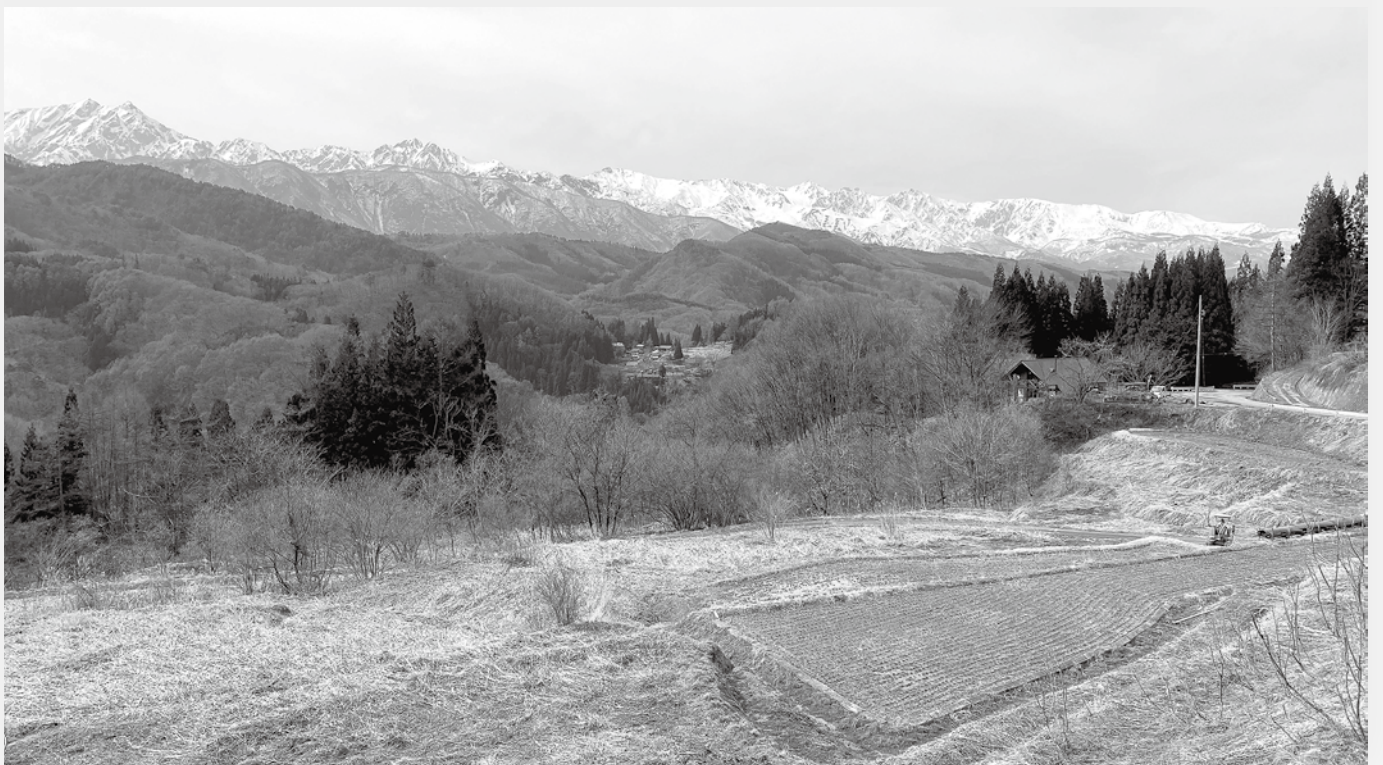
棚田からの北アルプス眺望