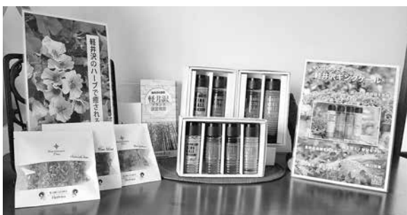
軽井沢キングケールドレッシング(中央)と 軽井沢ハーブティ(左)