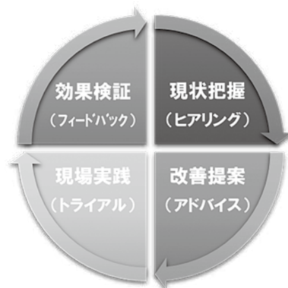
伴走型専門家派遣事業におけるPDCAサイクルイメージ

費用は無料で業種も問いません。本事業についてご関心のある事業者様がいらっしゃいましたら、商工連経営支援課(TEL026-217-2828)までお問い合わせください。