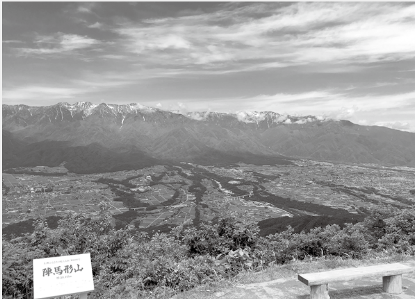
陣馬形山からの眺望

圏となっています。人口は約4700人、西には中央アルプス、東には南アルプスを望み、村の真中を天竜川が流れる自然豊かで風光明媚なところです。村の東側に位置する「陣馬形山」の山頂にあるキャンプ場はキャンプの聖地として知られ、最近のアウトドアブームもあり全国からキャンパーが集う場所となっております。陣馬形山からの眺望はすばらしく、眼下には蛇行して流れる天竜川、中央・南両アルプスを一望でき、キャンプだけでなく観光地としての人気も高く、多くの人であふれています。