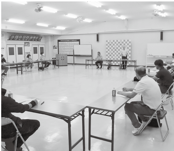
9月22日高森町商工会壮青年部設立総会