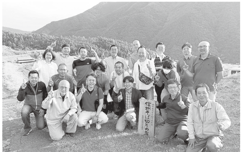
信州そば切りの会 勉強会

慣れ親しんだ、いわき市の街並みは目を覆いたくなる景色でした。避難所では私は、一人のお爺さんと出逢いました。お爺さんは、津波で家も家族も無