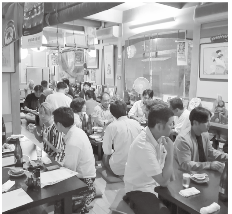
6月21日準備会の懇親会の様子