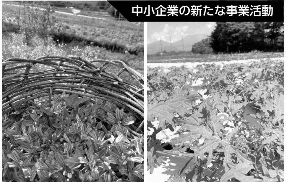
自社一貫製造のハーブ