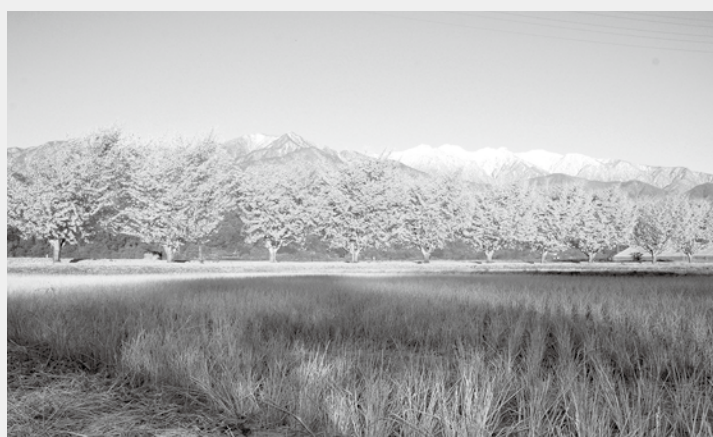
渡場のイチヨウ並木

全協議会」が田植えや稲刈りをおこない、収穫された酒米は清酒「おたまじゃくし」の原料として使用されます。近年隠れた人気撮影スポットとして渡場地区のイチヨウ並木があります。11月上旬から中旬が紅葉の見頃となり、冠雪の中央アルプスをバックにしたイチヨウ並木の写真はこの場所ではしか撮影できない瞬間です。