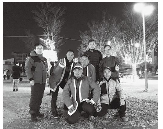
青年部で灯す今井駅イルミネーション

しかし、技術を売りにして商売をす る大変さやスタッフ・お客様との人間 関係などこれをとっても自分の思う様 にいかず、憧れとは打って変わって、 働き始めて3日で理想と現実が違うこ とに気づかされました。焦りから父と 衝突する事もありました。そんな中、 自分を変えたのは当時の川中島町商工 会青年部でした。青年部の先輩方には 波乱万丈な人生を歩んできた方々が沢