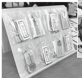
出来上がった干支札