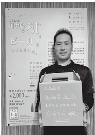
災害から生まれた桃のビールに 青年部でも協力

2021年夏、突然のゲ リラ豪雨の影響により川中 島の名産でもある多くの桃 が収穫を目前に木から落ち てしまいました。その規格 外となってしまう桃で埼