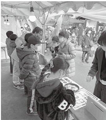
青年部と一緒に干支札の販売