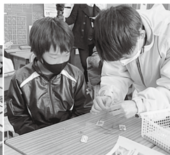
青年部と一緒に干支札作り

今年も年男・年女にちなんで栗が丘小学校5年生が干支札を作って安市「楽市楽座」で販売しました。昨年12月に青年部と一緒に作成したもので、割れることで持ち主の身を守ってくれる縁起物の身代札にコロナ収束の願いが込められています。