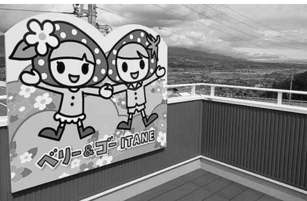
屋上からの素敵な眺望と喬木村公式キャラクター

だんに取り入れた地産地消メニューを提供しております。なかでも一日10食限定の日替わりランチは特に人気の高いメニューとして皆様にご好評いただいております。店舗の屋上からは、天竜川を眼下に中央アルプス、現在建設中のリニア中央新幹線長野県駅を望むことができます。地元の皆様に愛されるお店を目指しておりますので、ご来店を心よりお待ちしております。