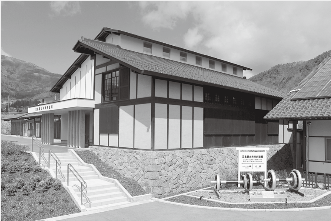
五島慶太未来創造館

青木村は、長野県の東部、上田市の西方約12kmに位置し人口は約4300人(令和5年1月末現在)。飛鳥時代後半に開湯されたといわれる「田沢温泉」、平安時代に開湯されたといわれる「香掛温泉」の2つの温泉と、鎌倉時代に造られた別名「見返りの塔」と呼ばれる「国宝大法寺三重塔」に象徴される豊かな自然と古い文化に恵まれた村です。 その青木村を代表する先人が、東急グループの礎を築いた実業家であるとともに教育者として次世代の育成に力を注いだ五島慶太です。 五島(旧姓小林)慶太は、中学校に進学する者が少数だった時代に勉学に励み、当時、県内に1校しかない中学校の支校である長野県尋常中学校上田支校(現長野県上田高等学校)まで、片道3里(約12km)の道のりを1日も休まず毎日2時間をかけて歩いて通った努力家です。令和2年