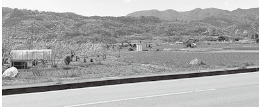
有限会社太陽自動車興業と店舗から見える景色