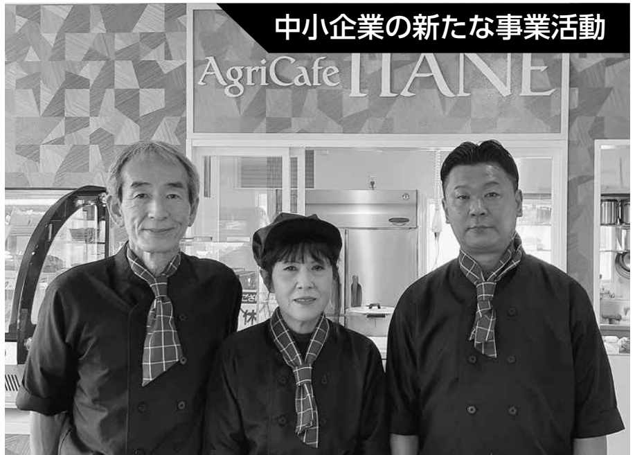
スタッフ一同 心よりお待ちしております