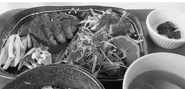
日替わり定食 (一例)

地産地消と食育をコンセプトに、村内養豚業者が育てた豚肉「信州くりん豚」や南国フルーツ栽培農家が育てた「信州メイヤーレモン」などの地元食材をふんだんに取り入れた地産地消メニューを提供しております。なかでも一日10食限定の日替わりランチは特に人気の高いメニューとして皆様にご好評いただいております。