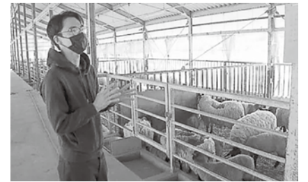
めん羊繁殖センター

わつてもらいたい、その気持ちでさざり荘の運営を開始した矢先、台風19号と新型コロナウイルスにより宿の運営は厳しいものとなりました。お客様は激減、宴会にいたっては全ての予約が無くなりました。そして肉をはじめ全ての原材料が高騰し、温泉を温めるための灯油も1日で3万円分燃やすこともあります。新型コロナウイルスはサフォークの生産者にも影響を与え、先行きが見えないために減産ということになりました。 このままではお客様に最高の肉を提供できなくなる、それだけは何とか阻止しなければならぬと思い、2021年から羊の繁殖・肥育を始めました。一切畜産の経験が無いため多くの課題に直面しながらも、お世話になってきた農家さんのお力を借りながら2022年3月に初出荷を迎えました。その羊肉はやはり極上で、お客様に自信をもって提供できる仕上がりになりました。