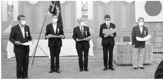
表彰商工会代表者

は過去に例をみないほどの苦境に立たされております。商工会では、商工会長の陣頭指揮の下、職員が一丸となって、コロナ対策に関する施策を地域