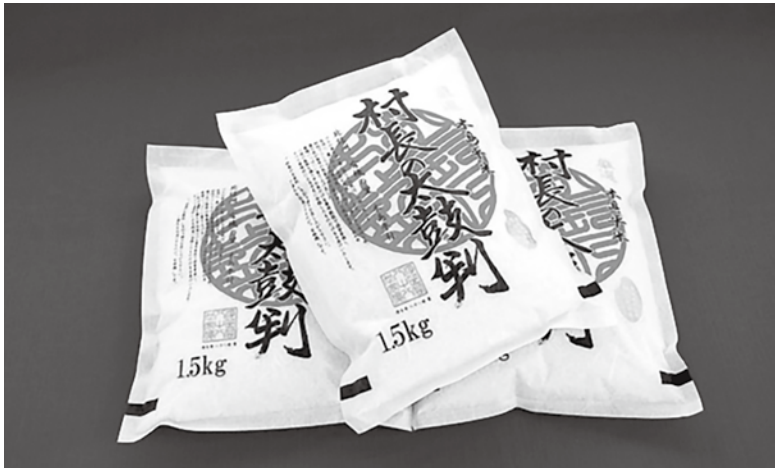
木島平米「村長の太鼓判」

木島平村は農業と観光が基幹産業です。村内には広大な田畑があり木島平村の特別栽培農産物「木島平米」ブランドがあります。品質が良く、米のオリンピックと呼ばれる「米・食味分析