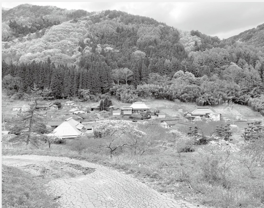
花桃が咲く旧武石村

町村合併により上田市に合併されました。現在、上田市には上田商工会議所、真田町商工会、上田市商工会の3つの