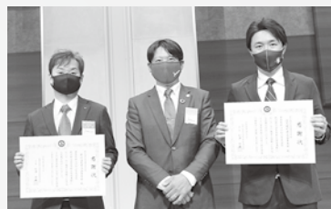
感謝状を受けた野沢温泉青年部、佐久穂町

県青連は5月10日（火）長野市「ホテルメトロポリタン長野」において、新型コロナウイルス感染症の感染防止対策を徹底し、出席者を青年部長に限定して令和4年度通常総会及び青年部リーダー研修会を開催しました。県下各地から会場出席が33名、Web配信によるリモートで4商工会青年部が視聴しました。