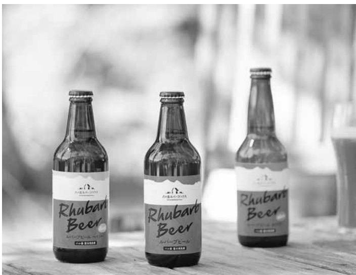
ルバーブビール3種

ルバーブ商品開発に関し、また同時に不慣れた異業種での業態は手探り状態であるが、無事スタートを切れたのは多くの方々の協力と知恵の賜物であり、改めて感謝するとともに、これに報いるべく、更に精進してゆく所存であります。