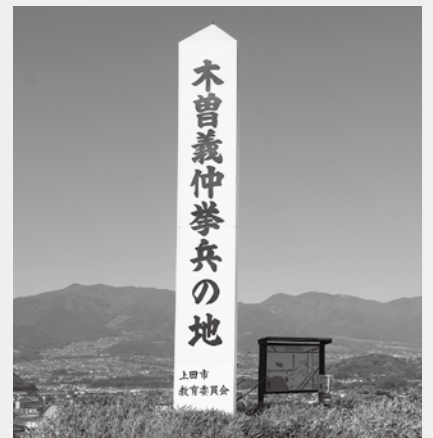
木曾義仲 拳兵の地

丸子では4年に一度、拳兵を模した「木曾義仲拳兵武者行列」が行われており、主役である木曾義仲、巴御前をはじめ、100人余りの参加者が甲冑を身にまとい商店街を練り歩きます。2022年は木曾義仲行列が開催される年で、NHK大河ドラマの宣伝効果もあり地域活性化の起爆剤になることが期待されています。