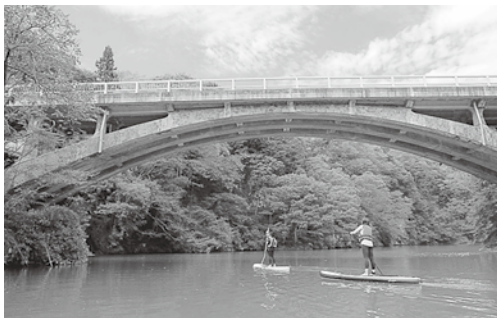
久米路峡サップツアー「ジャングルクルージング」

私は信州新町に元々ある羊文化と久米路峡を、少しの工夫でその魅力を高めることが出来たと思います。同じような観光資源は長野県や全国にまだまだ存在していて、いつかインバウンド需要が戻ってくるときに備えて、今から開発していければ未来は明るいものになるはずです。長野の中でも田舎な信州新町から世界を見据えて、これからもお客様に感動を与えられるサービスを続けていきます。