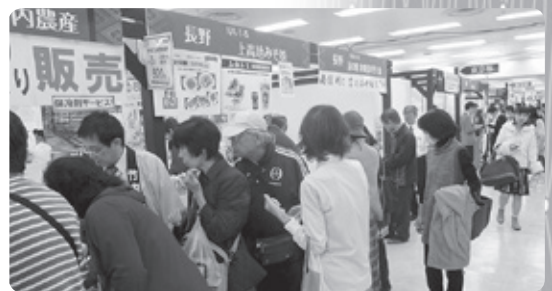
来客で賑う長野県ブース