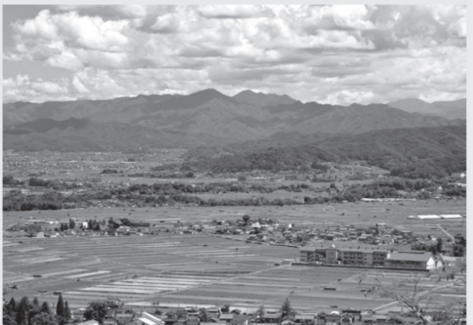
初夏の五郎兵衛新田（蓬田）

8月14日には今年で66回を数える浅科納涼花火大会を開催しています。会員の皆様には寄付金集めから始まって会場の設営、駐車場確保、道路標識の設置から運営まで参加頂いております。特徴は東信地区では最多の尺玉（10号玉）が上がることです。今年も36発打