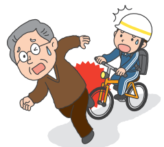
自転車を運転中、あやまって他人と接触してケガをさせてしまった!