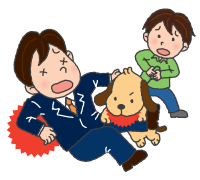
飼い犬が散歩中に他人に噛みつきケガをさせてしまった!