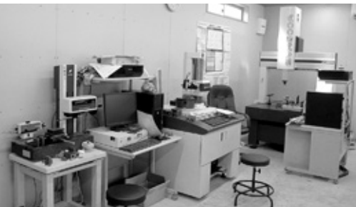
ものづくり補助金で導入した測定機器類

製造業では、人（従業員）の育成と、機械設備への投資は欠かせません。従業員については、地元採用を優先しており、雇用を通じて地域経済に貢献したいと考えています。一方機械設備に関しては、当社では過去5回ものづくり補助金の申請をしており、2回採択されました。1 今回は、真円度円筒形状測定機、コンピュータ数値制御のCNC3次元座標測定機、表面粗さ・輪郭形状測定機を導入、当社の品質管理レベルを担保でき、お客様からの評価も変わり、受注開拓にも役立っています。2回目は、横型マシニングセンタを導入、従来よりも難易度の高い加工にも対応でき、受注できる仕事の幅が広がりました。補助金申請にあたっては、県地域振興局や商工会の支援を受け、今まで頭の中にあつたことを整理してストーリーとしてまとめることができました。現在人手不足が叫ばれる状況ですが、当社は山間部にあるからこそより一層深刻化することは目に見えています。一方で、こうした地域で会社が無くなってしまふと、働く場所が無くなるので、地域の人にも流出してしまいます。今後は、地元での雇用は守りつつ、人手不足に対応するように、社内生産体制の自動化を進めた