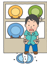
買物中、あやまって商品を落として割ってしまった!