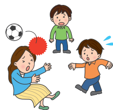
友人同士で遊んでいる最中に、あやまって通行人にケガをさせてしまった!