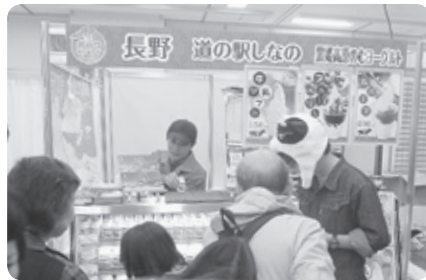
おやつランキング枠