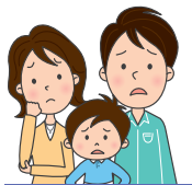
補償を受けられる方