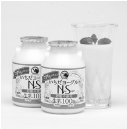
いちだヨーグルトNS150ml

今回取り組んだ製品開発では、原料乳の良さを生かし、砂糖を使わなくてもおいしく飲んでいただける乳酸菌を探し、製造工程を確立することが必要でした。必要とする乳酸菌にたどり着くまでに時間もかかりましたし、作業工程を確立するにも苦労しました。1年かけて出来上がった製品は、南信州産の生乳を、砂糖を使わずに生乳本来の味わいと深いコク、トローンとした飲み心地に仕上げました。当社の「いちだヨーグルト」と比較しますと、カロリーは約3/4、炭水化物は約1/3となっています。糖類は、3.8g