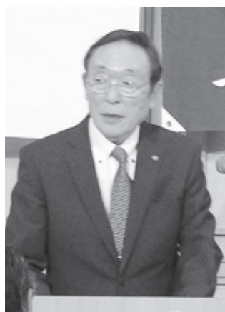
柏木商工連会長あいさつ

商工連は5月29日、松本市のホテルブ エナビスタにおいて平成30年度通常総会 を開催し、提出された平成29年度の事業 報告と決算等の議案はすべて承認されま