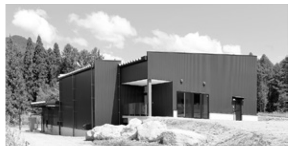
(株)信州たかやまワイナリー

「この人に注目」をシリーズで毎号掲載しています。商工会地域内で頑張っておられる方をご紹介ください。