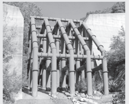
ユニークな形の砂防ダム

わずか2・1%と山深い自然豊かな小谷村では、春は山菜、秋はきのこが豊富に採れるため山菜きのこの宝庫といわれており、季節限定で村内飲食店で味わうことができます。また村内には小谷温泉・姫川温泉をはじめ効能豊かな11か所の温泉があり温泉好きなら名湯をいくつも楽しめます。県内でも有数の豪雪地帯でもあり、梅池高原・白馬乗鞍温泉・白馬コルチナの三つのスキー場があります。梅池高原スキー場では初心者でも安心な広い緩斜面から上級者が楽しめるゲレンデまでありヘリスキー（リフトのないところや高い山にヘリコプターに乗って着陸し、滑降する）などのアクティビティも充実しています。白馬乗鞍温泉スキー場では良質のパウダースノーを楽しむの圧雪していいコースやモーグルコースがあり、スノーシューやバックカントリーのツアーなどが楽しめます。また白馬コルチナススキー場では良質なパウダーが人気で世界中から多くのスキーヤーが訪れ、キッズパークや託児施設も充実しています。