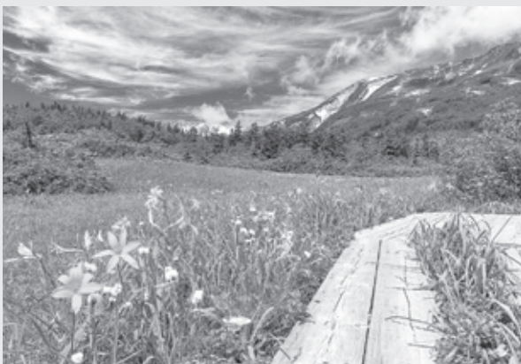
ニッコウキスゲが咲く梅池自然園

そんな小谷村には日本三大崩落の稗 ひえ 田山大崩落や砂防ダムを巡るツアー、こしよ漬けやビスケットの天ぷらなどなど、まだまだ世間にはあまり知られていないこともたくさんありますので、ぜひ一度お越しいただくとともに小谷村へ移住定任をお考えいただければと思います。お待ち申し上げます。