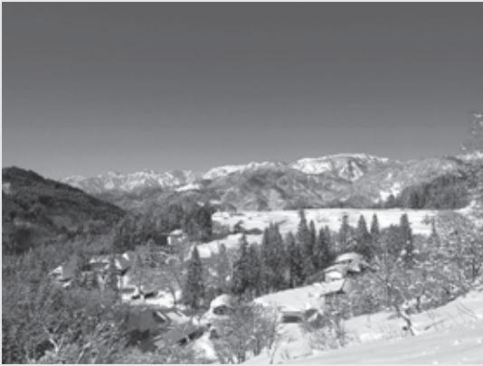
北アルプスを望む冬の小谷

わずか2・1%と山深い自然豊かな小谷村では、春は山菜、秋はきのこが豊富に採れるため山菜きのこの宝庫といわれており、季節限定で村内飲食店で味わうことができます。また村内には小谷温泉・姫川温泉をはじめ効能豊かな11か所の温泉があり温泉好きなら名湯をいくつも楽しめます。県内でも有数の豪雪地帯でもあり、梅池高原・白馬乗鞍温泉・白馬コルチナの三つのスキー場があります。梅池高原スキー場では初心者でも安心な広い緩斜面から上級者が楽しめるゲレンデまでありヘリスキー（リフトのないところや高い山にヘリコプターに乗って着陸し、滑降する）などのアクティビティも充実しています。白馬乗鞍温泉スキー場では良質のパウダースノーを楽しむの圧雪していいコースやモーグルコースがあり、スノーシューやバックカントリーのツアーなどが楽しめます。また白馬コルチナススキー場では良質なパウダーが人気で世界中から多くのスキーヤーが訪れ、キッズパークや託児施設も充実しています。