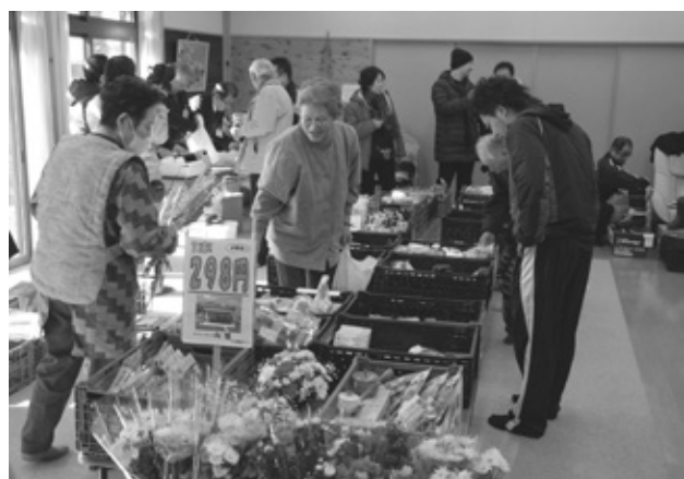
売場の様子：商品を見て触れて購入できます。

る臨時職員を雇用し、委託事業者のNPO法人理事長、商工会経営指導員、事業発足から携わってきた上松町の担当係長と、事業主体の四輪が揃いました。