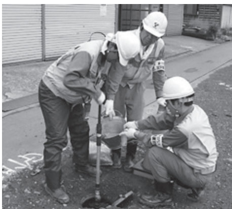
東邦ガス様の導管復旧活動 （平成19年新潟県中越沖地震）