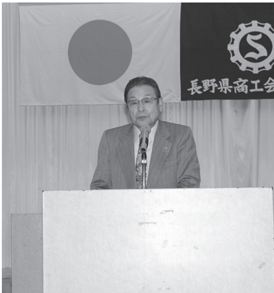
矢崎商工連会長あいさつ

このほか総会の席上、商工貯蓄共済、会員福祉共済、特定退職金共済、記帳機械化事業に係る優良商工会の表彰も執り行われました。