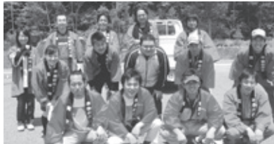
開田高原ゴミ拾いに集合 木曾町商工会青年部

青年部では、今回の表彰をきっかけにこれからも社会貢献活動を積極的にを行うことを考えています。