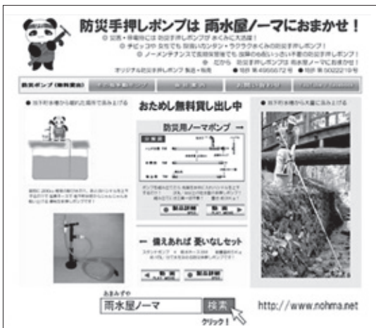
防災ポンプ「おためし貸し出し」PRページ