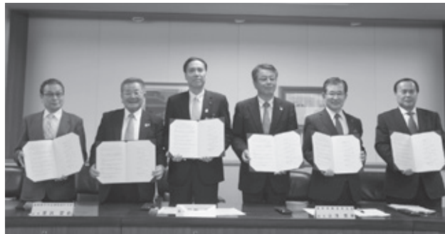
調印式にて出席者一同