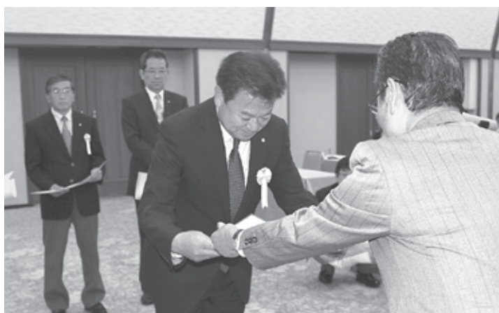
表彰を受ける春日木曾町商工会長