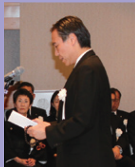
弔辞 阿部長野県知事