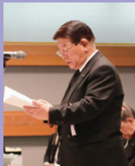
弔辞 石田県議会議員・商工会議員懇談会会長