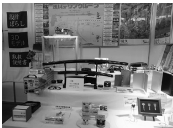
「浅科テクノグループ」出展ブース

「他企業の製品見学を通じ、自社の加工技術のレベルアップが図れ、取引先の評価があがった。」「来場者・出展企業との情報交換や情報収集ができた。」「自社の知名度が向上した。」「社員教育・育成