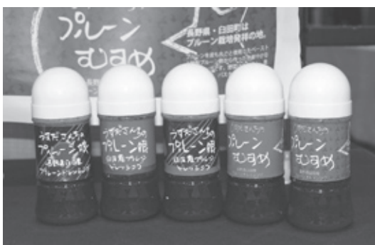
白田町商工会女性部 「うすださんちのプルーン娘 白田産プルーンドレッシング」