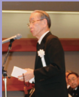
弔辞 石澤全国商工会連合会長