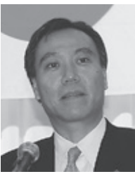
阿部知事よりごあいさつ

さらに、職員資質の向上による支援能力の強化、創業及び新事業分野への進出を目指す人材育成支援を行う「とのあいさつ」のあいさつがありまし