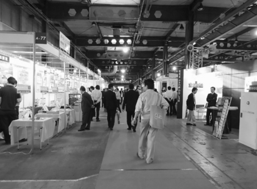
ブースが立ち並び賑わう会場