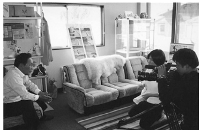
長野朝日TVインタビュー

「この人に注目」をシリーズで毎号掲載しています。商工会地域内で頑張っておられる方をご紹介します。