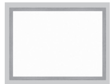
木曾材山ザクラの和風額縁

経営革新・農商工連携・地域資源活用・新連携等の計画認定を検討されている方は地元商工会へご相談ください。