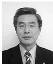
特定社会保険労務士 中小企業診断士