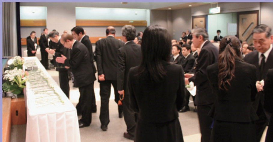
献花 商工会関係者