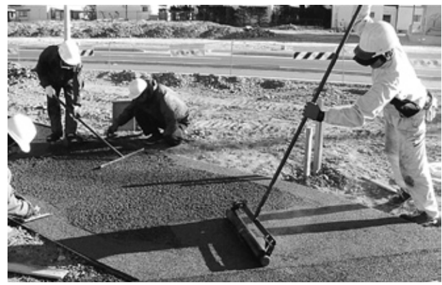
遊歩道ゴムチップ施工

今の世こそ奪え合えば足りず、分け合えば余るの言葉をよく噛み締めて、今後とも喜んで頂ける商品開発、あつて良かったと言われる企業、社会・地域に貢献でき、社員がハッピーになれる会社をめざして生き抜く所存でございます。宜しくご指導頂ければ幸いです。