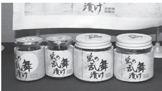
辰野町商工会女性部 「ほたるの乱舞漬け」