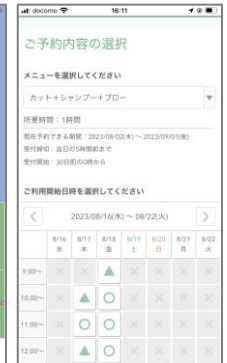
オンライン予約システム