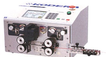
ワイヤーカッター