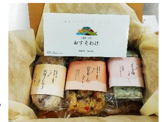
5品目が入った「安曇野池田おすそわけ」セット