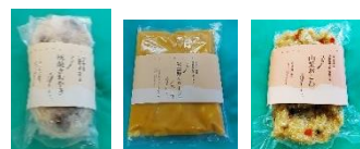
真空パックされた各商品