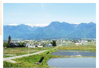
美味しい農産物が作られる綺麗な空気と水の池田町