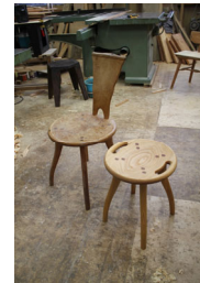
今回輸出する「木製椅子」2種