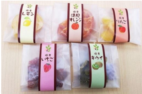
ドライフルーツ商品

当社は事業の急成長に伴い新工場を増設する事になり、長野県の補助事業である「信州ものづくり産業応援助成金」に応募した。助成金対象事業とする為には「エコアクション21」の認証取得が必須項目で「阿智村商工会」「上席専門経営支援員」「環境専門家」でチームを結成し、同社の支援を行った。