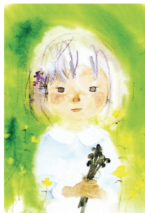
いわさきちひろ わらびを持つ少女 1972年

いわさきちひろの作品や人生と共に、世界の絵本画家の作品や絵本の歴史を、5つの展示室で紹介しています。美術館が建つ松川村は、戦後、ちひろの両親が開拓農民として暮らした土地です。ちひろは、折にふれて松川村の実家に里帰りし、この地を心のふるさととして愛していました。安曇野の自然とけこむようにして佇む建物は、内藤廣氏の設計によるものです。美術館の周囲には36,500㎡の公園が広がっており、赤ちゃんからお年寄りまで、一日ゆっくり楽しめます。