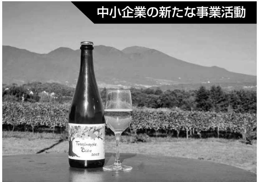
たてしなアップルシードル