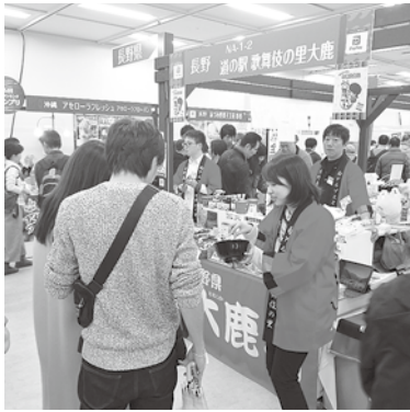
長野県ブースには6店が出展 県内特産品の販売とPRを積極的に行いました。

技能・功績の要旨：こけら葺きの屋根職人として、材料のこけら板の製作から屋根葺きまでを手掛ける優れた技術を有するとともに、こけら板の製造の技術を伝承し後継者の育成に尽力しています。