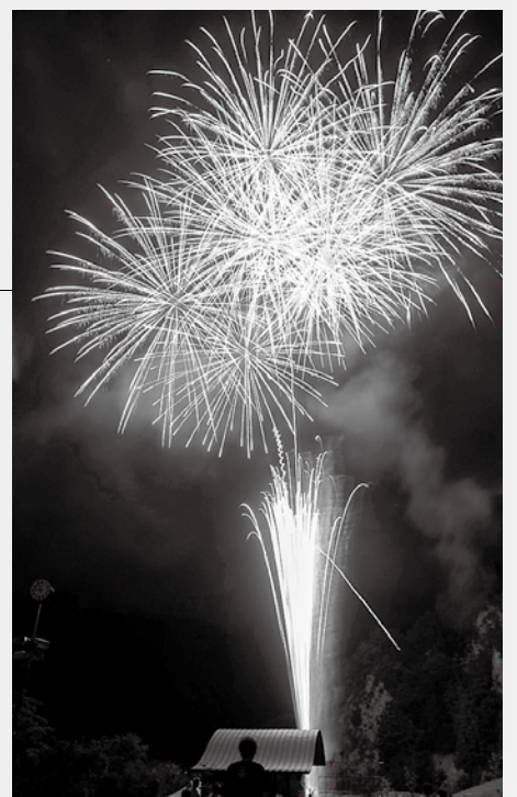
大鹿夏まつり煙火大会

歌舞伎」の定期公演もあります。春と秋の2回、大磧神社と市場神社 いちろば の回り舞台にて上演されます。歓声が上がります、おひねりが舞い、毎回多くの方にご来場いただいております。大鹿歌舞伎がモデルとなった、映画「大鹿村騒動記」で全国的に有名になり、2017年には地芝居 じしばい の分野では全国初である国の重要無形民俗文化財に指定されました。 毎年8月14日には大鹿夏まつりが開催されます。大煙火大会は山谷に反響する音が胸に響き、他では味わうことのできない大迫力です！