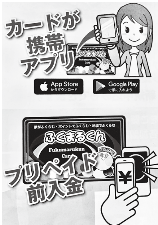
ふくまるくんアプリ

現金チャージのメリットは、現金・小銭が不要、決済が早い、簡単、便利、時代に合っているといった一方で、アプリだ、チャージだ、QRだ、QRだ、と聞きなれない横文字や操作に戸惑う方も多く、問い合わせも毎日いただいておりま