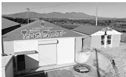
たてしなアップルワイナリー

にあり、南傾斜地で粘土質、陽当たりや風通しがよく、朝夕の寒暖差が大きいため、糖度が高く硬質なりんごができるのです。一般的なりんごの糖度は12〜15度とされるなか、立科の完熟ふじりんごの糖度は20度近く。この特別に甘いりんごを使用することで、発酵に必要な糖を余計に加えることなく、りんご本来の持つ甘みだけでシードルを造ることができます。