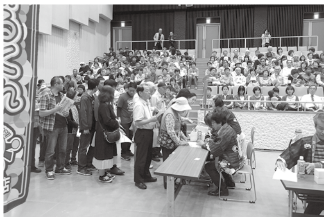
大盛況のふくまるくんカード切り替えイベント

施策として位置付けられ、「ふくまるくんの利用促進」について村からの支援も受けており、行政ポイント（村指定の事業に参加することでポイントが発行される等）の導入も検討されています。