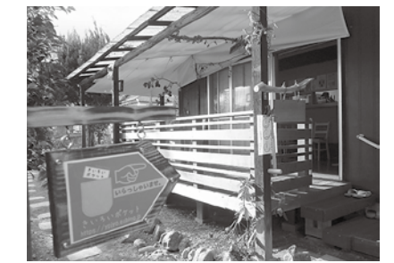
きいろいポケット

種類を使い、その違いを比べてみました。焼き立てではハチミツの甘さは出ません。一晩寝かせて、