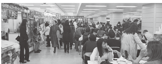
人気の「ご当地フードコートコーナー」にも座りきれない程の来場がありました。

商工連としても、会期中の事業者の運営支援や、長野県観光マップの配布等を実施し、長野県の観光・特産品のPR活動を展開しました。