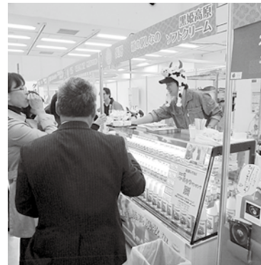
来場者の投票でランキングを決定「ご当地おやつランキング」