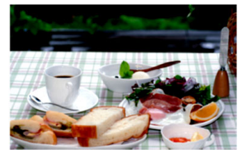
パンも野菜も自家製の物のみ

代表者は豊田市から軽井沢に引っ越されて、13年前から自宅がある別荘地で喫茶店を経営し、テイクアウトやイベントなどで物販を行っている。 また、野菜は自家栽培した物を喫茶店で提供している。 しかし、すべての業務を代表者が1人で行っているため、提供数は限られる。 商品は拘りをもって作られており、どれも大変美味しい商品で、根強いファンも多いが、別荘地内の営業のため、来客数が限られるという課題があった。 より豊かな老後が過ごせるよう、今から販路拡大に向け、商談会に参加できる準備を整えた。