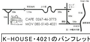
K-HOUSE・4021のパンフレット